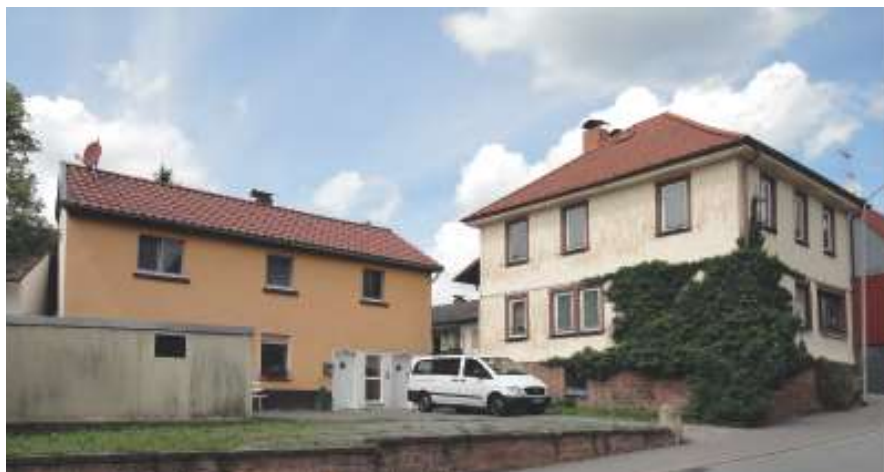
Vorher | Straßenansicht