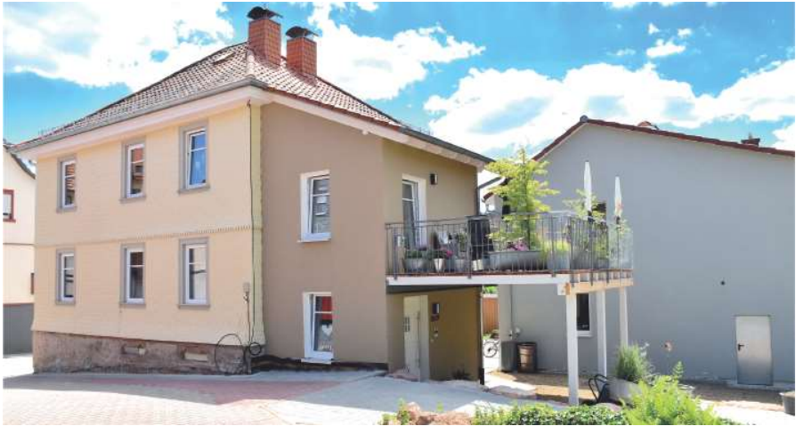
Nachher | Rückansicht