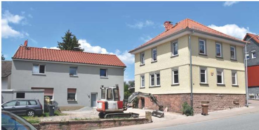
Nachher | Straßenansicht