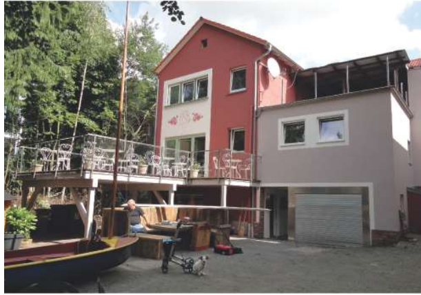
Nachher | Rückansicht