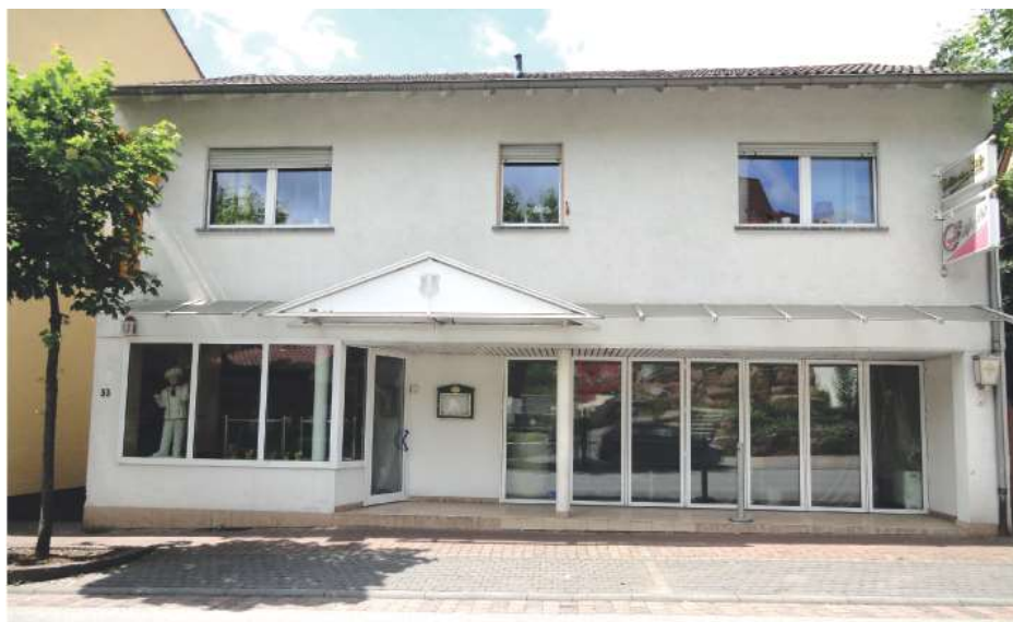
Vorher | Straßenansicht