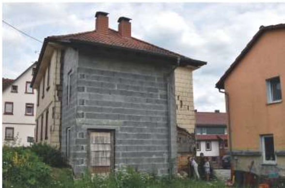
Vorher | Rückansicht

Gebäude mit Erneuerung der Fenster, Sanierung der historischen Holzschindelfassade und Sand- stein-Kellersockel, Anbau einer Balkonanlage