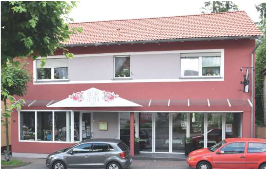
Nachher | Straßenansicht